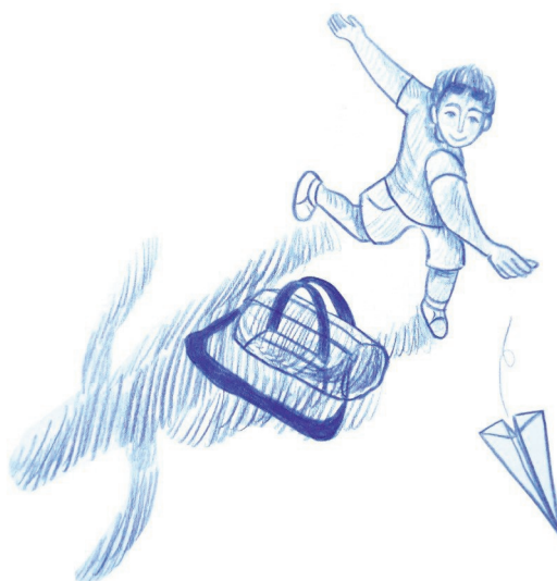
ILLUSTRATIE ELLEN BEUTING

kan veranderen zodra ze ouder worden", zegt Tamar de Vos van Opvoedadvies.nl .